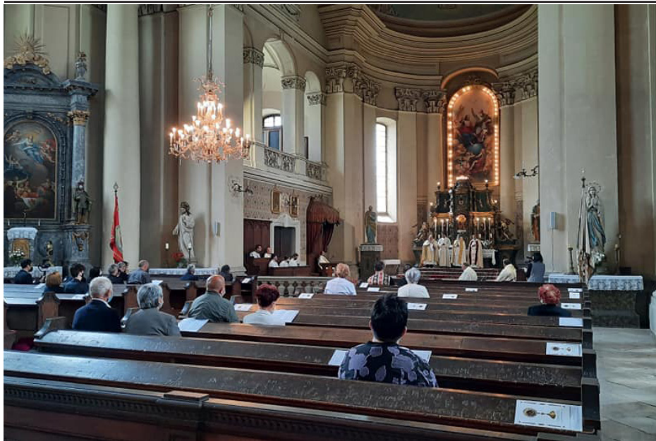
Világosító Szent Gergely napja