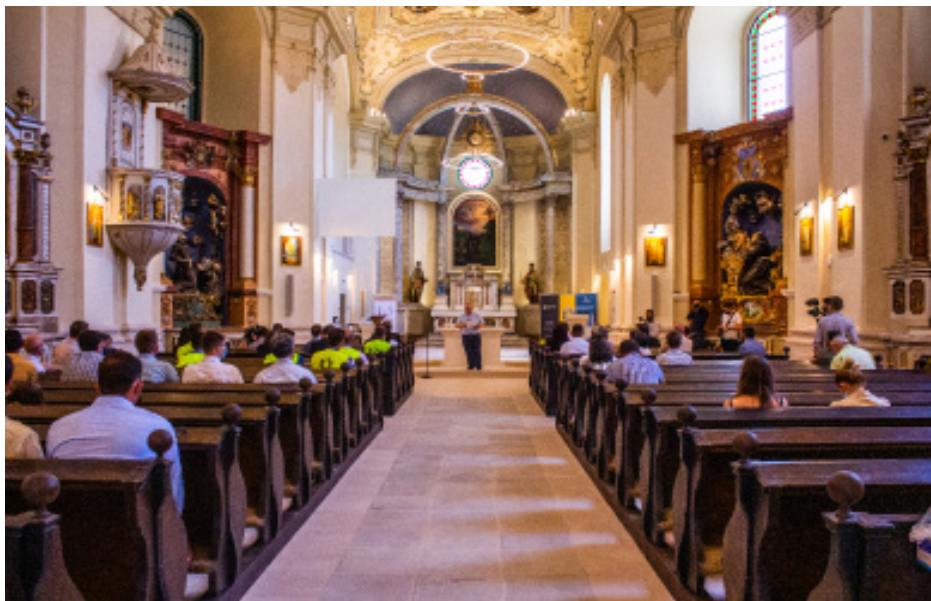
A megújult római-katolikus templom /Riti József Attila