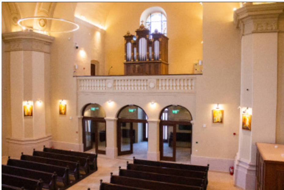
A megújult római-katolikus templom /Riti József Attila