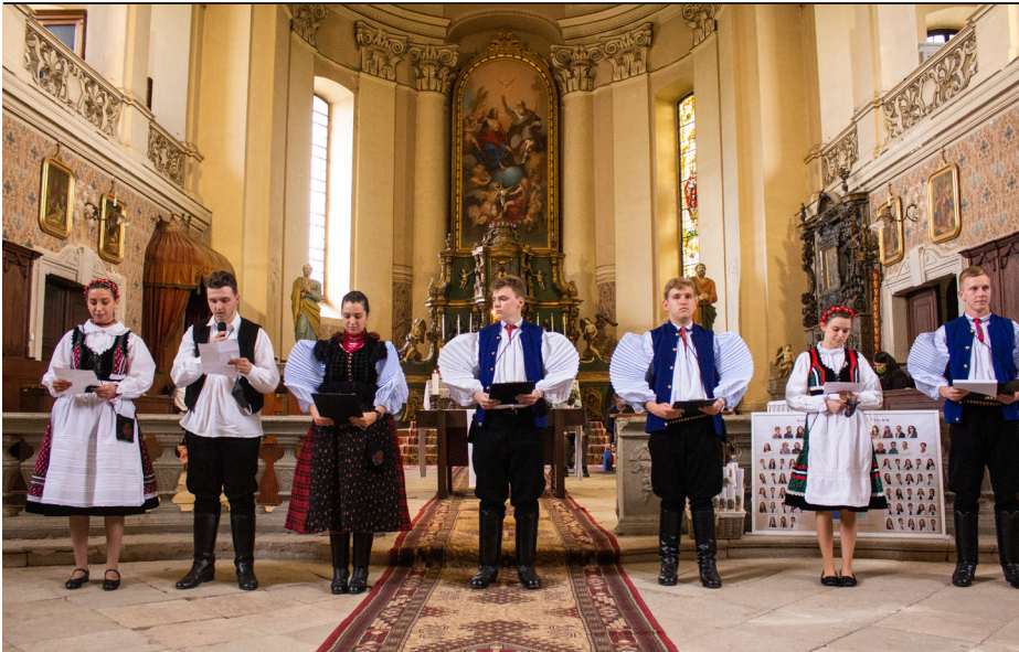
Ballagás a templomban / Riti József Attila

Az RMDSZ tanácsosok folytatni szeretnék a kerekasztal megbeszélések sorozatát, legközelebb az egyházi vezetőkkel, majd pedig a helyi vállalkozókkal szeretnének tanácskozni, hogy megismerjék problémáikat és igényeiket.