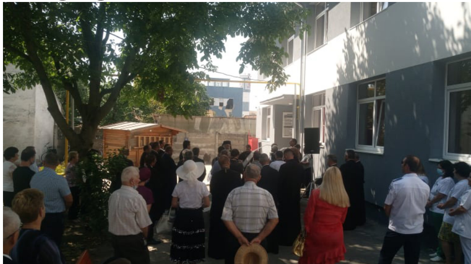
A poliklinika átadása