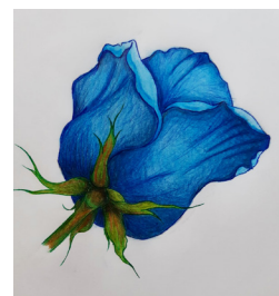
Juhos Izabella rajza

Ilyen, ha járvány száll a szélben. Menny el kicsiny madaram, Kérlek, hozd vissza én édes nya- ram!