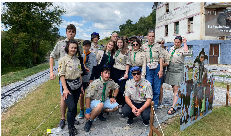
51. Czetz János cserkészcsapat

Kolerajárványok napjainkban is vannak, a legutolsó 2017-ben volt Jemenben.