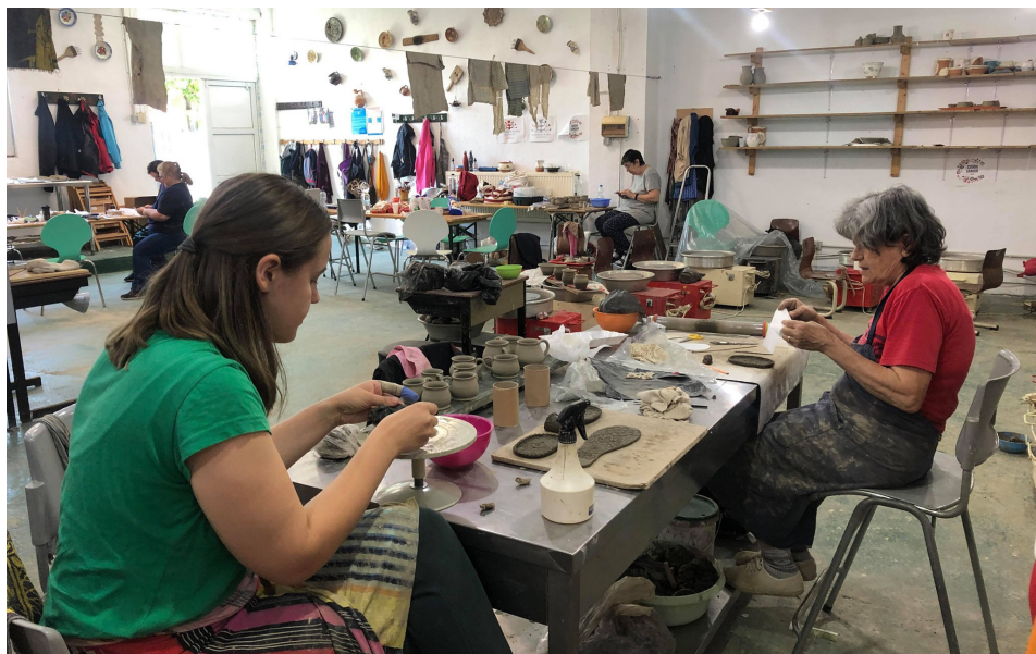
A felnőtt kézműves tábor