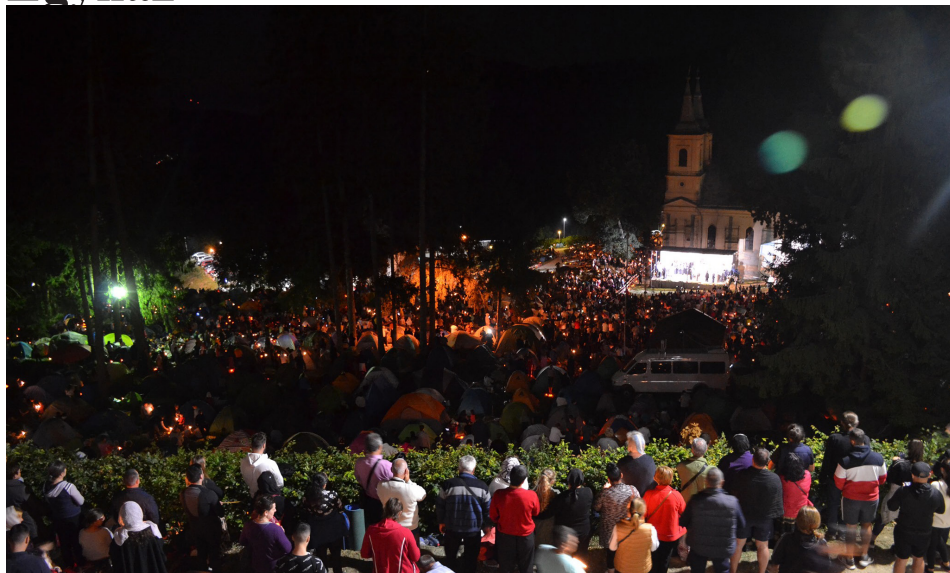
A füzesmikolai búcsú