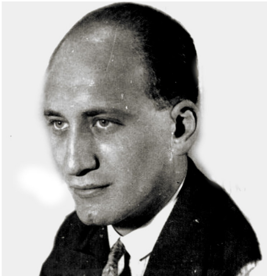
Rejtő Jenő