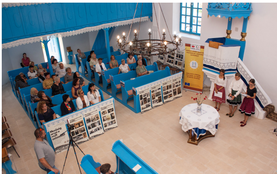
Kulturális Napok