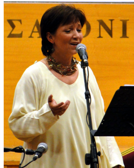
Sebestyén Márta