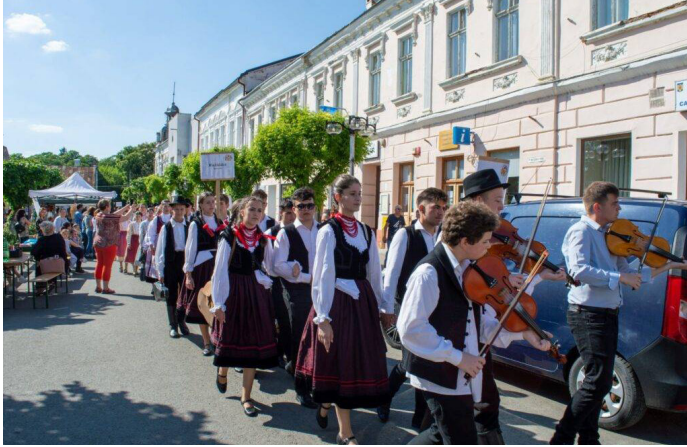
Ismét a téren a Kaláka