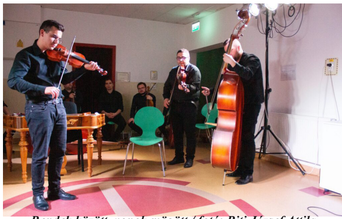
Rendek között, vonok mögött

bizonyult, de jó alapokat kaptunk, Egy új kaput nyitott meg, melybe közösen léphetett be a résztvevő tíz szamosújvári pedagógus. A közös élmény és együtt tanulás csodákra képes. A 2020 februárjában tartott természettudományos élményképzés óta az első olyan képzés, amin a szamosújvári pedagógusok nem online formában vesznek részt.