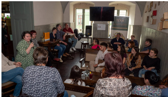
Elszigetelve könyvbeemutató