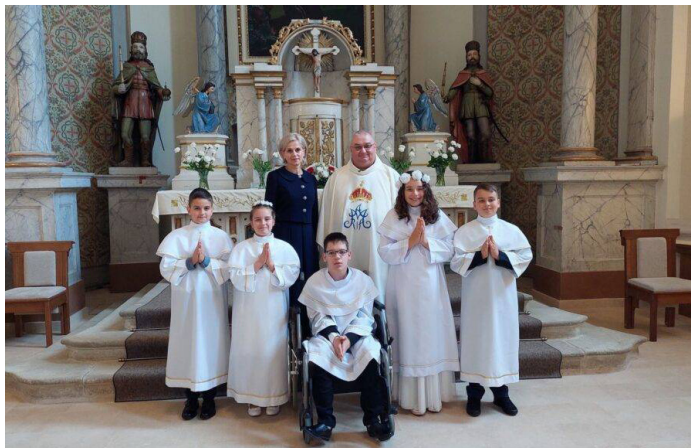
Elsőáldozás Szamosújváron