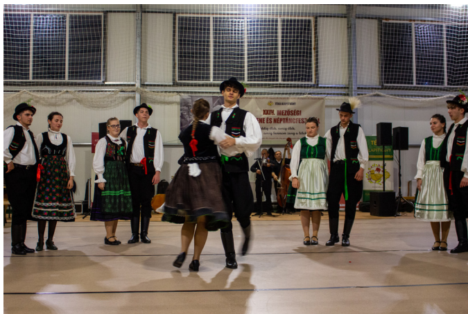
A vajdakamarási táncosok

És ma sír, zúg, bűg, zen- dül az avar: Holt ifjúságom most élni akar!