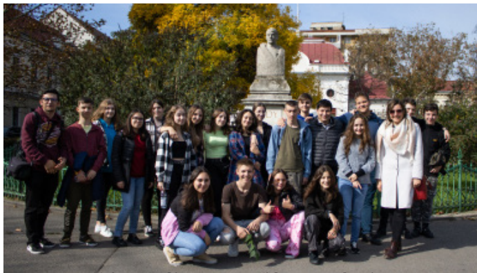
A 9B osztály a szecessziós Nagyváradon