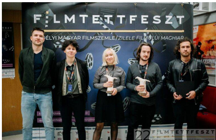
Filmgalopp díjazottak