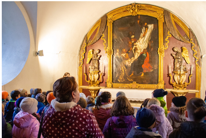
Elemisek a székesegyházban