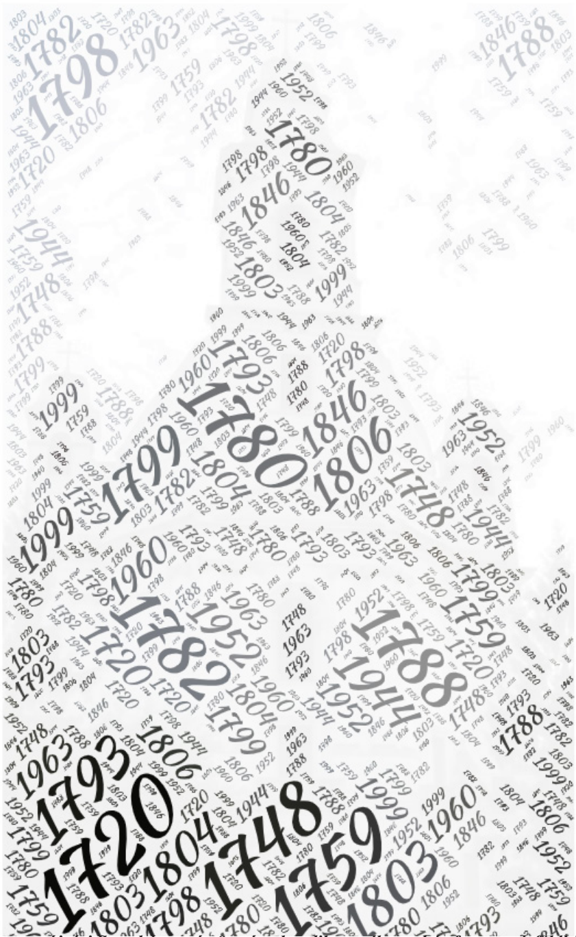
A szamosújvári Szentháromság örmény-katolikus szélességyház fontos mérföldkövei