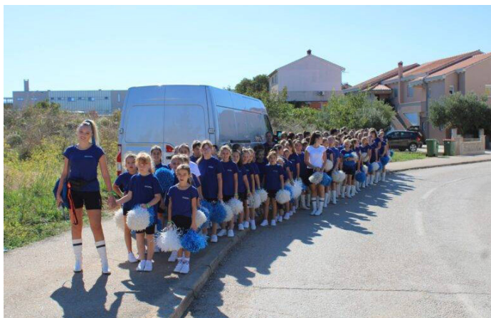
Queens Dancing Horvátországban